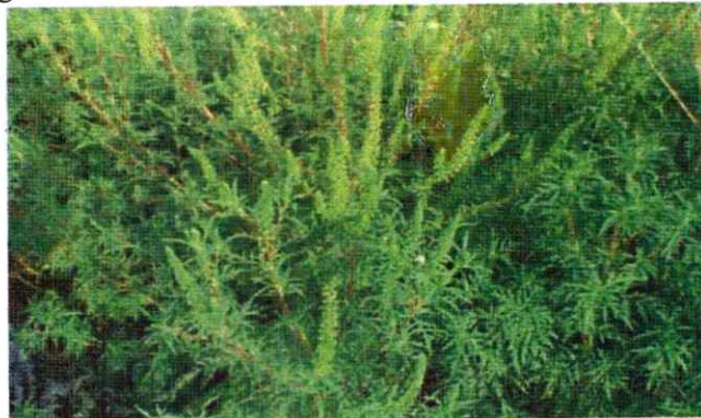
Figura nr. 5.2