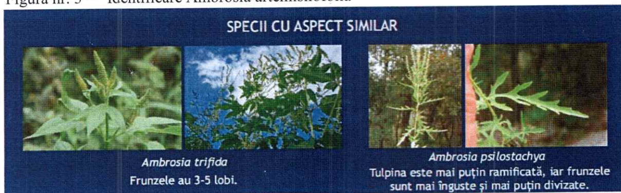
Figura nr. 4 — Specii cu aspect similar cu specia Ambrosia artemisiifolia

Ambrosia este una dintre cele mai invazive plante existente pe teritoriul țării noastre, fiind extrem de adaptabilă la condițiile pedoclimatice.