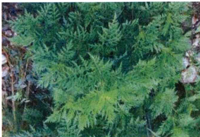
Figura nr. 2.2