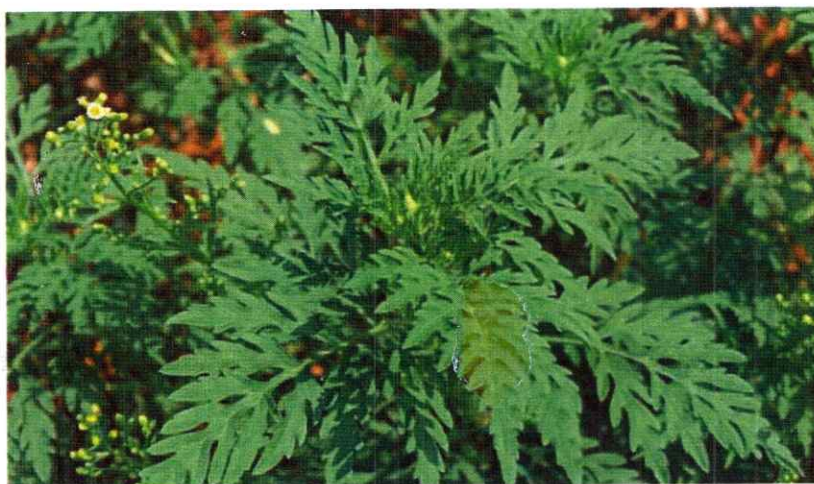
Figura nr. I — Ambrosia artemisiifolia

Din punct de vedere morfologic și plasticitate ecologică, Ambrosia artemisiifolia este o plantă anuală, răspândită în toată Europa, cu areale invazive concentrate, în special, în partea centrală a acesteia.