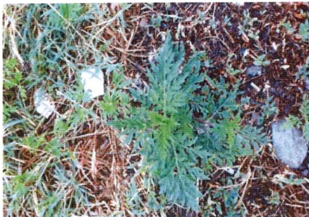
Figura nr. 2.1

În figurile 2.1 — 2.3 este prezentată buruiana ambrozia în primele faze de vegetatie.