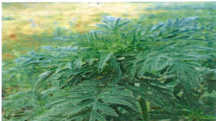
Figura nr. 2.3

Fructul este o achenă acoperită cu spini, de formă ovoidă, care conține o singură sământă mică de culoare maron cu un vârf în formă de săgeată.